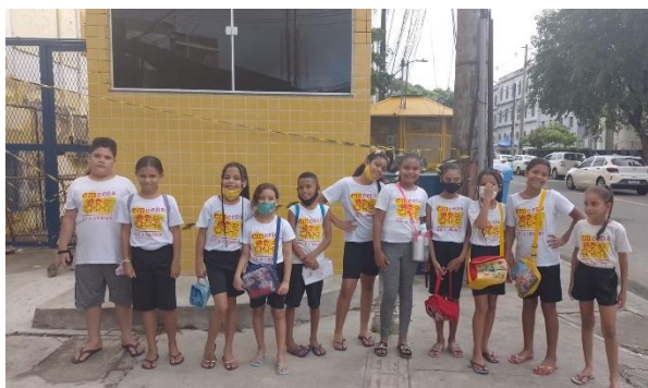
Indo para a aula de teatro, atrás o portão interditado

Oficina de Teatro | No período que se iniciou em abril e vai até junho as crianças vivenciaram a Oficina Teatro Semente, um projeto da CIA Fiandeiros de Teatro com as crianças da Em Cena Arte e Cidadania