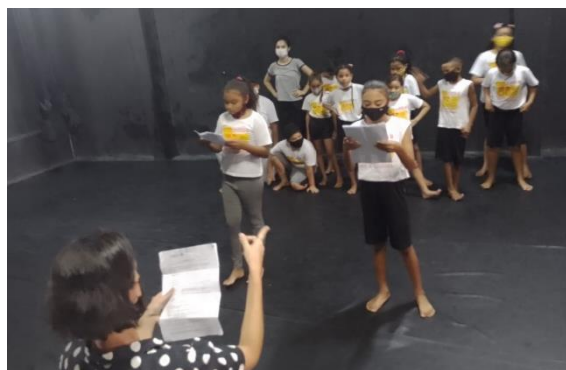
Tendo aula de teatro no espaço da escola Fiandeiros de Teatro